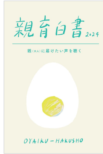
活動協力金 500円/冊(税込)

今回の親育白書2024には、前回のものとは異なり、まずは、私たちのこと、この白書ができるまでの物語を綴らせていただきました。その後は、アンケート調査の流れに従って、4つの章に分けて、結果をまとめております。親育研究会メンバーが項目毎に「私の視点」というコーナーで、意見を綴っていますので、そちらもご覧いただけたらうれしいです。