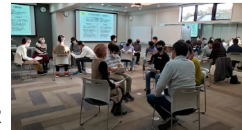
Hata Moku x Oyaiku Network Meeting