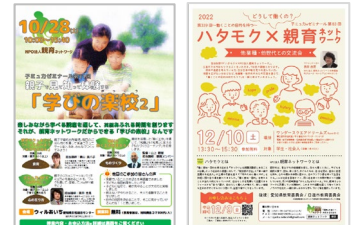
↑ これまでたくさんの特別企画を開催してきました